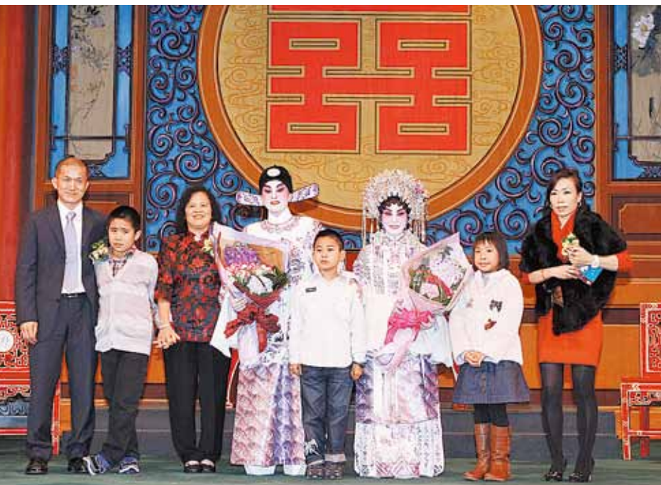
■主辦單位及演員上台謝幕。