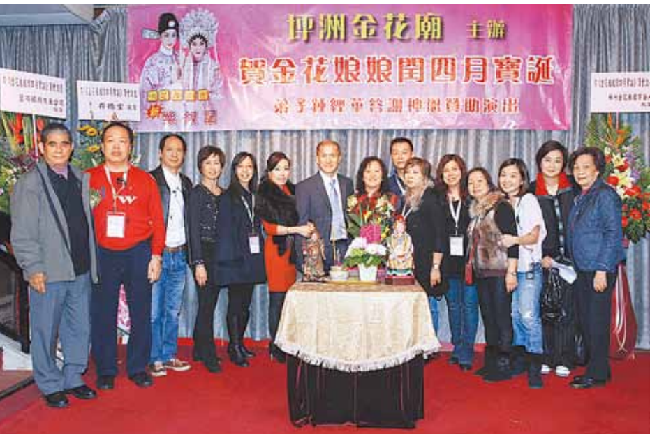
■一眾有份為活動出力的義工。