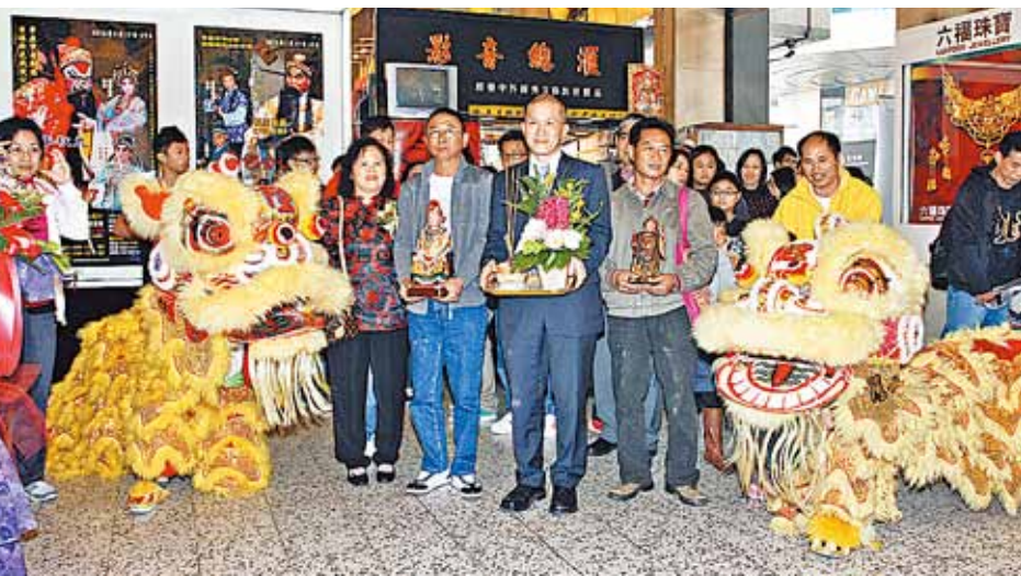
■大會在開場前先進行了醒獅儀式。